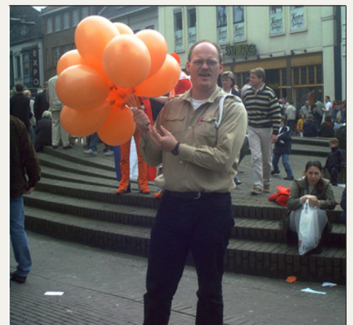
Koninginnedag - Ballonnenverkoop