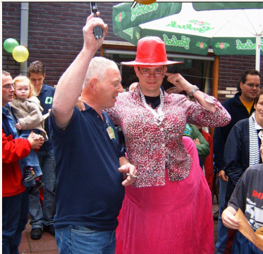
Opening clubgebouw 2005