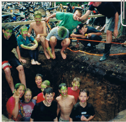
Ontgroening van Pluvieren